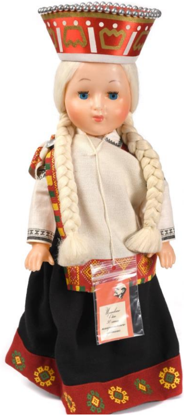
Lelle 'Baiba' LNVM krājums, Fx-23-L5