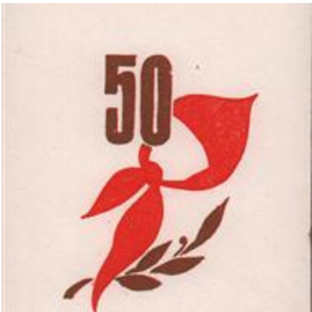
Ludzas novadpētniecības muzejs, LdNM 3551/1

Muzejā izstādītajam, kanonizētajam pionieru kaklautam, tāpat kā skolas solam, ir savdabīgi vienojoša funkcija – tas nav tikai lokālās vēstures daļa, bet ir saprotams simbols vairākām paaudzēm, kas augušas Austrumeiropā.